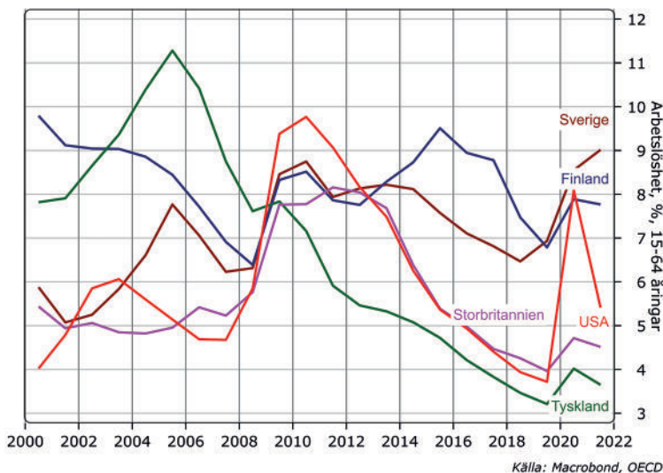
Figur 2. Arbetslösheten i samma länder från 2000 framåt. Orsaken till att USA har en relativt låg sysselsättningsgrad trots att arbetslösheten är låg ligger i att ovanligt många i landet varken är sysselsatta eller söker jobb.

gern i smaken är att den utgår från att såväl arbetsmarknaden som marknaderna för varor och tjänster bör få fungera så fritt som möjligt utan någon inblandning från statens sida, eller åtminstone med en så minimal statlig inblandning som bara är möjligt. För arbetsmarknadens del innebär det här att lönebildningen är fullständigt fri – vilket utesluter såväl lagstadgade minimilöner som facklig inblandning i löneförhandlingarna – och att lönerna vid behov också kan flexa nedåt. Därmed kan en nedgång i totalefterfrågan, enligt utbudsekonomens sätt att se på saken, på sin höjd förorsaka en kortvarig ökning av arbetslösheten.