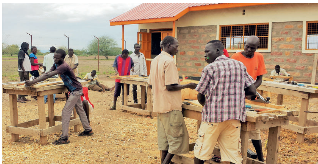
Yrkesutbildning vid Kalobeyei Youth Training Center i flyktinglägret i Kakuma.

målsättning att tillhandahålla permanent bostad fanns det flera inbäddade mål och program som gjorde att denna operation fungerade.