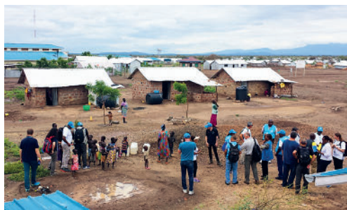
Bilden till vänster visar presenningskydd och bilden till höger de permanenta härbärgena och teamet som möter hushållens medlemmar.

en inledning till avhandlingen, där jag inleder med att berätta om de erfarenheter som fick mig att genomföra denna forskning. Sedan utforskar jag varför försörjningskedjor är viktiga för att tillhandahålla kontant- och kupongassistans, och slutligen tar jag upp vad framtiden möjligen innebär för detta ämne.