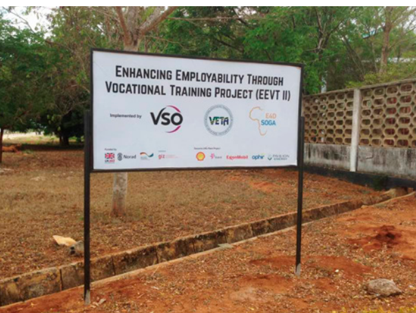
Skylden marknadsför ett projekt i Mtware yrkesskola som finansierats av oljeföretagen som investerar i området.

delen av forskningen i denna avhandling har gjorts, rapporterar europeiska företag att de årligen spenderar 11 miljoner euro på socialt ansvar (Europeiska kommissionen, 2022).