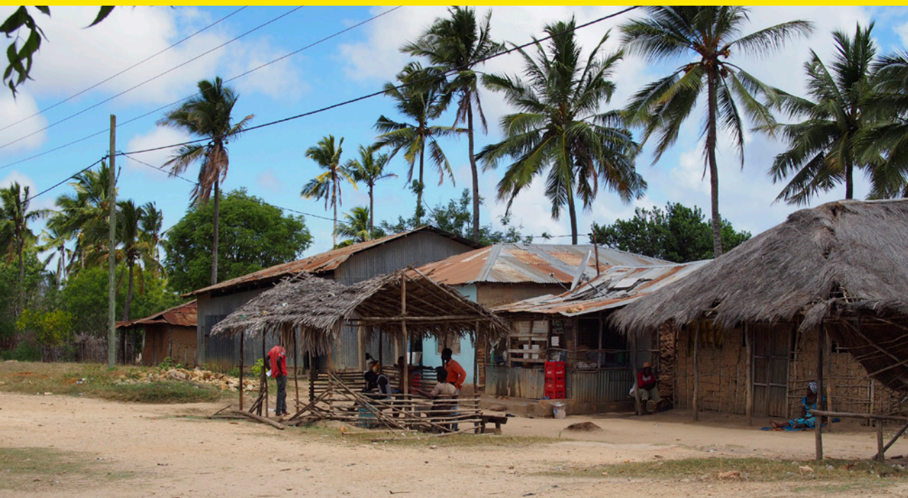
LNG-anläggningen ska byggas i närheten av byn Likong'o i Lindi.

verksamheten. Men när jag började min undersökning, fann jag att jag hade haft fel om staternas roll och makt i förhållande till företag och företagsansvar.