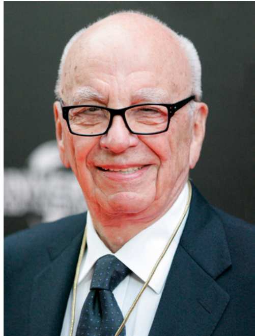
Rupert Murdoch lär ha sagt att för att komma till tals med beslutsfattare i Bryssel måste han boka tid, medan politikerna i London bokar tid hos honom.

Något senare samma dag, som denna ordväxling ägt rum, ringde Neils telefon. I andra ändan hörs Murdochs röst "Jag hörde just att du portat vår största annonsör". Neil erkände och förklarade orsakerna till beslutet. Murdochs följande fråga löd: "För hur