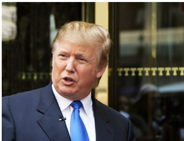
Silvio Berlusconi och Donald Trump är nutida exempel på en politisk uppgång som befordrats av extrem rikedom.

kratiska värderingar. Det är en berättigad kritik av ett kapitalistiskt system som inte är i balans, men för att göra en ensidig bild fyligare kunde Alfani ha gärna ha undersökt ett rikare urval av källor rörande de nyrika i dag. Det finns trots allt gott om företagare och innovatörer bland dem, och även sådana som berikar sig på att lyfta lön och gager.