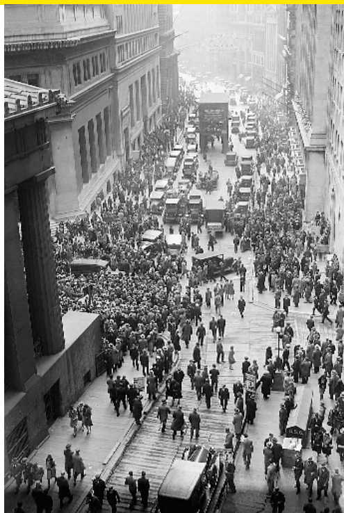
Förväntningar i kras. Människor samlas på Wall Street efter börskraschen 1929.

undantag, tonades ner inom ekonomin. Ren teoretisk härledning lämnar svårligen någon roll för moraliska ståndpunkter och/eller etiska överväganden.